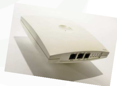
IP Cobs 3000